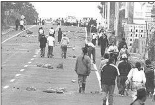
Bloqueo de carretera en Imbabura durante la movilización del pasado 16 de febrero

por su corresponsabilidad en los hechos de narcotráfico, nepotismo, peculado, y protección a criminales de esa humanidad como el represor argentino, Suárez Mason.